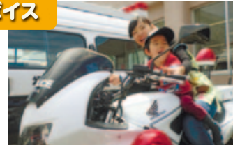
●児童発達支援 放課後等デイサービス ●障害福祉サービス事業所コパン・クラージュ