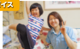
●ハーモニーみどりヶ丘 デイサービス