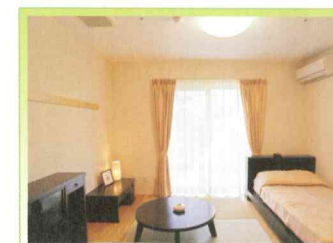
和室タイプ(使用例)