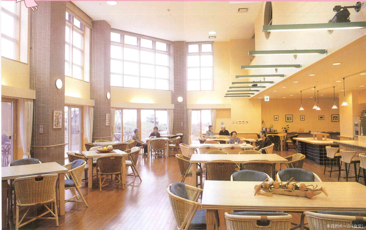
多目的ホール(食堂)