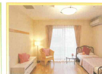
洋室タイプ(使用例)